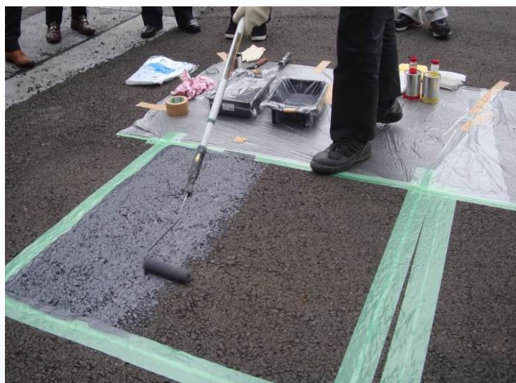
ローラーで簡単に施工出来ます